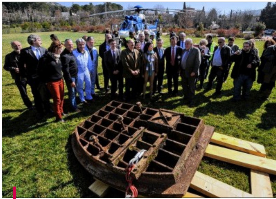
La pièce métallique d'1,7 tonne reste à dater précisément. Elle faisait partie d'un ouvrage de 1475.

L'EC225 peut soulever jusqu'à 5 tonnes (ce qui amène le poids total en vol, hélico compris, à 12t). La bestiole coûte quelque 20 M€ et son heure de vol est estimée à 10 000 €. Un coût partagé entre aiRtelis, RTE et Eurocopter pour l'intervention d'hier.